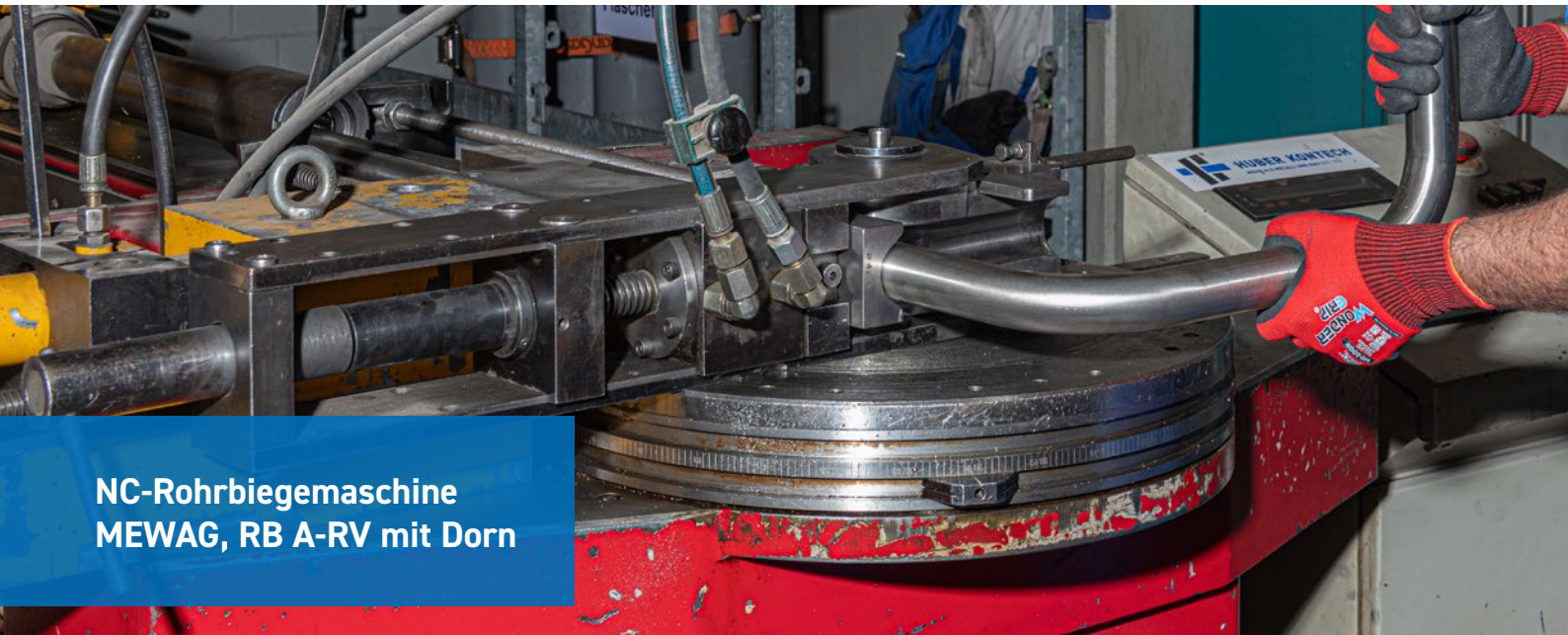
NC-Rohrbiegemaschine MEWAG, RB A-RV mit Dorn